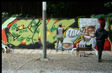
美式噴漆塗鴉(字母大作)